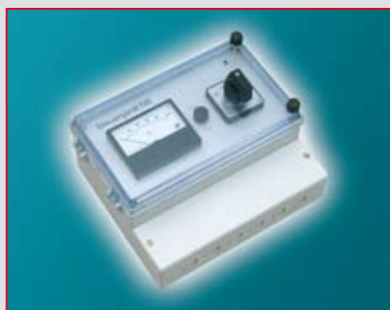
Steuergerät NB Standard Control unit NB Standard Appareil de commande NB Standard