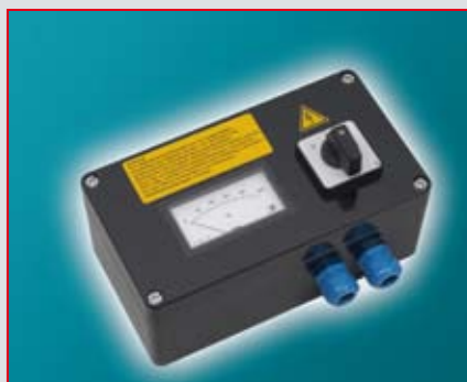
Steuergerät NB für Ex-Zone 22 Control unit Explosion zone 22 Appareil de commande pour la zone Ex 22